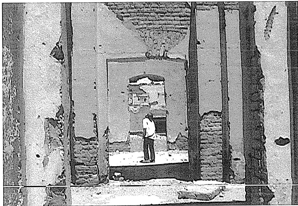
Lida Abdul, Dome , 2005. Single-channel digital video, 4 minutes 50 seconds, 4:3, colour, sound.

It can, then, follow the miracle of art, without any meaning (if “meaninglessness” has already inscribed its original violence and force), as if to imprint its last and authorial countersignature: in “White Horse” (2006), Abdul’s loving “Treatise” closes its pages on a man who paints a horse (a dear animal in Afghani culture), 10 the white paint covers its brown skin so as to enable the living surface to transport the signs of art through the landscape, among humans. It is not the artist to paint the surface of the ruin any more; it is a simple man, who does not cover the whole body of the horse, but only half of it—art cannot and does not want to act as a healing force, but as an act of love that wants to enhance the wound, by trying to cover it in order to better highlight it, so as to carry it elsewhere, where, perhaps, it can claim its transformation: